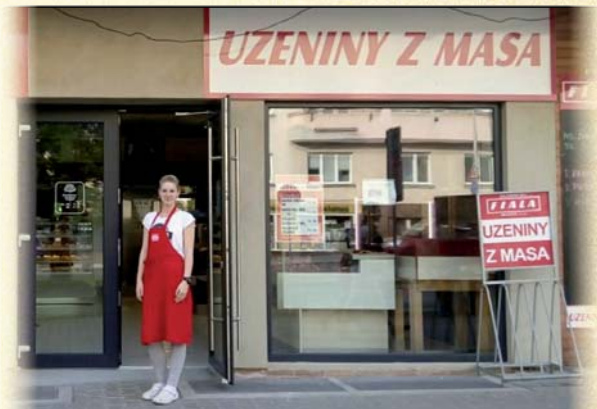
Trída V. Klementa 1227, Mladá Boleslav tel. 778 766 897