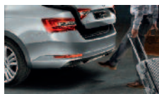
Virtuální pedál – bezdotykové otevírání 5. dveří