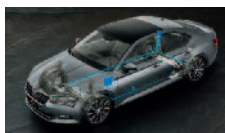
Adaptivní podvozek – volitelné nastavení podvozku ve 3 režimech (Comfort, Normal, Sport)

ŠKODA usnadňuje život svým zákazníkům každý den.