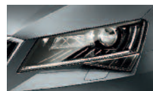
Smart Light Assist – automatické přepínání a clonění dálkových světel