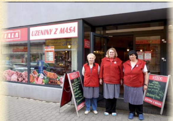
Železná 49, Mladá Boleslav tel. 739 029 553

Těšíme se na Vás v našich prodejnách v Mladé Boleslavi: